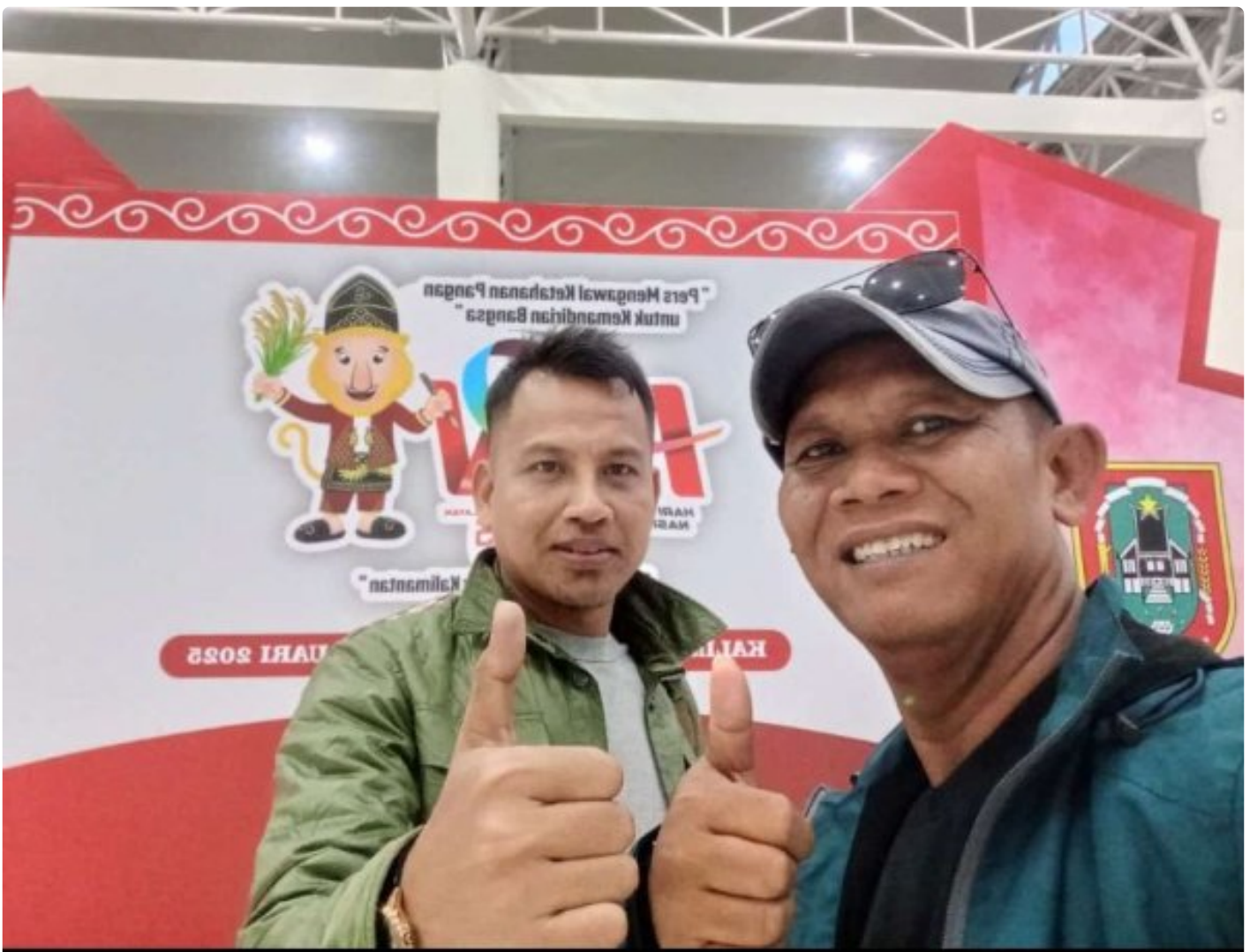
Sekretaris dan Bendahara PWI Kabupaten Morowali

MOROWALI, Sulawesi Tengah- Pengurus Persatuan Wartawan Indonesia (PWI) Kabupaten Morowali, Sulawesi Tengah menyatakan siap mengikuti puncak peringatan Hari Pers Nasional (HPN) di Banjarmasin, Kalimantan Selatan.