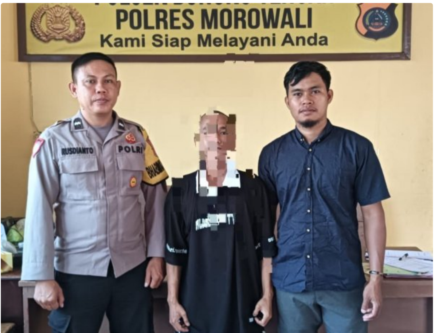
Aparat Polsek Bungku Tengah Berhasil Tangkap Pelaku Curanmor

MOROWALI, Sulawesi Tengah- Pada Hari Sabtu 5 Oktober 2024 Sekitar Pukul 18.30 Wita Kepolisian Sektor (Polsek) Bungku Tengah Polres Morowali, berhasil mengungkap kasus pencurian kendaraan bermotor (curanmor) yang terjadi di