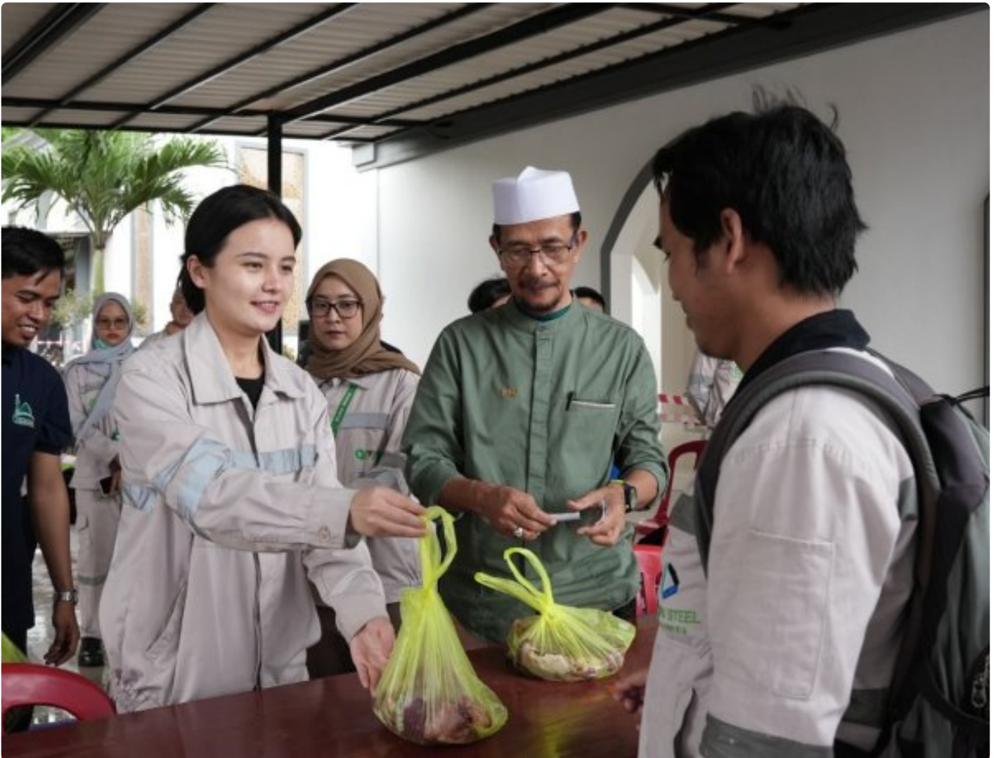
Karyawan non muslim di PT IMIP panitia kurban